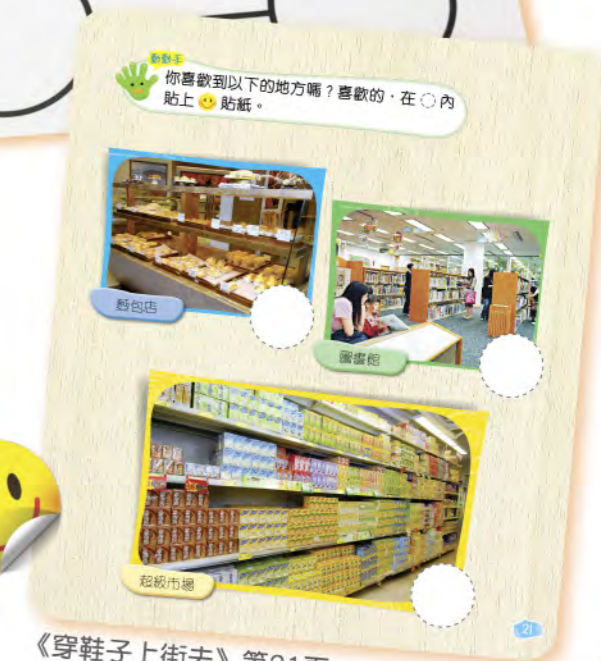
《穿鞋子上街去》第21頁